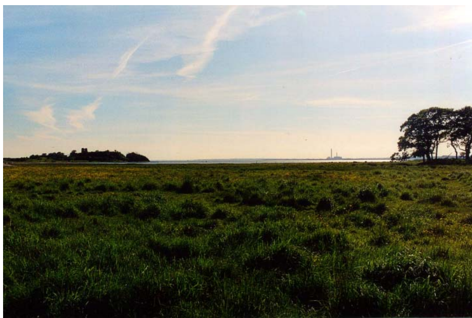
Figur 3: Den første øvelse – i at sanse – foregik på engene og i skoven ved Kalø slotsruin – et område med en stor spændevide af sansemæssige og æstetiske tilbud.

Deltagerne fik til opgave at bruge hele deres sanseapparat i iagttagelsen af naturen – syn, hørelse, lugtesans, evt. smag, hudens, leddenes og musklernes følesans. Som introduktion til den æstetiske sansning blev de bedt om at ”se” med barnets øjne – uhildet, fri for forudgående viden og tolkning – eller at ”se med hjertet”. Disse billedlige beskrivelser synes alment forståelige som introduktion til at danne det sammenhængende, kvalitative og følelsesmæssige indtryk af det iagttagne, som karakteriserer den æstetiske erkendelse (Relph 1979, Berleant 1992, Tuan 1993, Højring et al. 2004b).