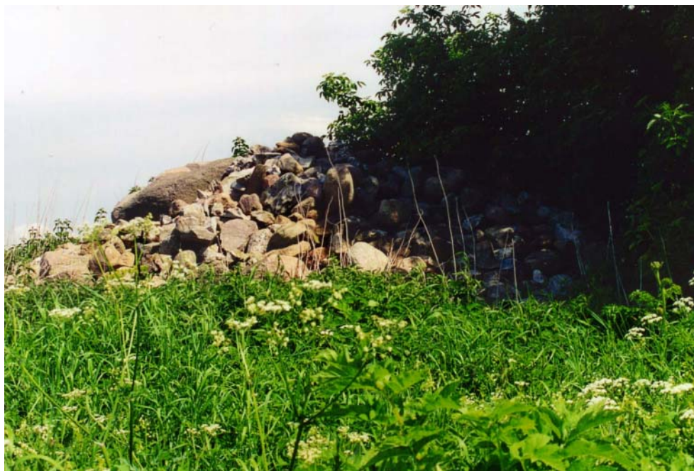
Figur 9: En mulig indikator for naturkvalitet – levesteder for bestemte dyr og planter, i dette tilfælde en rydningsrøse.

I den sidste øvelse i forløbet, hvor deltagerne i praksis skal se på naturkvalitet, har de overvundet noget af den videnskabelige distance til objektet og tilbøjelighed til at danne fagbestemte abstraktioner. De gør således en række almene iagttagelser, som ser ud til at kunne bruges som grundlag for udviklingen af indikatorer for naturkvalitet, som er umiddelbart iagttagelige. Feltøvelsen åbner således en forbindelse mellem det, der kan sanses, og den videnskabelige forståelse af naturkvalitet. Processen medfører også, at der reelt inddrages nogle andre kriterier for naturkvalitet end dem, der i udgangspunktet er defineret som relevante. I praksis, når det drejer sig om almindelige landbrugslandskaber, har de oprindelige kriterier (Tybirk og Ejrnæs 2001) en meget lille relevans, fordi de reelt kun er relevante i forhold til arealer, som er meget lidt berørt af menneskelig aktivitet. De kriterier, der fremstår på baggrund af øvelsen, er diversitet, sjældenhed og miljømæssig renhed.