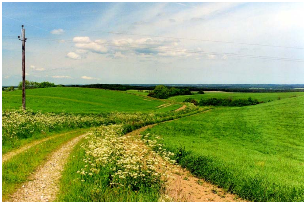
Figur 1: Natur defineres og opleves meget forskelligt afhængigt af personlig, social og kulturel baggrund.

Indikatorernes relevans er imidlertid afhængig af, hvordan man definerer naturkvalitet, og hvilke mål man tilstræber. Enighed om indikatorer forudsætter derfor enighed om definitionen på naturkvalitet. Forudsætningen for forståelsen af, hvilken type naturkvalitet man ønsker at opnå, er, at de parter, der har en interesse i naturkvalitet, er i stand til at kommunikere og udveksle deres forskellige forestillinger og forventninger i et sprog, der er tilgængeligt for alle parter i sagen. Kommunikation er således middel til bevidstgørelse om egne standpunkter og til etablering af en fælles målforståelse (Højring et al. 2004b).