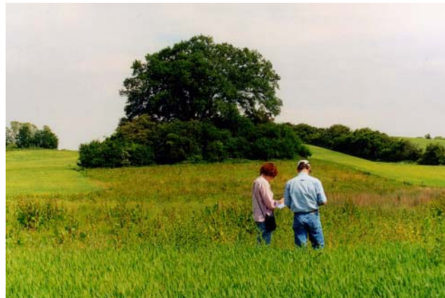
Figur 5: Den tredje øvelse havde til formål konkret at forsøge at udpege natur- og landskabselementer, som kunne fungere som enkle indikatorer for naturkvalitet.

Formålet med den tredje øvelse på workshoppen var at få deltagerne til gennem en mere åben og omfattende brug af deres sanser og sansning at forsøge at finde frem til nogle indikatorer for naturkvalitet, som ville være umiddelbart iagttagelige også for ikke-eksperter. Øvelsen bestod af to dele, en feltøvelse, hvor gruppen var delt op i hold á to personer, og en efterfølgende fælles diskussion. De to deltagere kom fra hver deres fagdisciplin for at repræsentere forskellige faglige synsvinkler på naturen, og for at repræsentere forskellige måder at iagttage natur på.