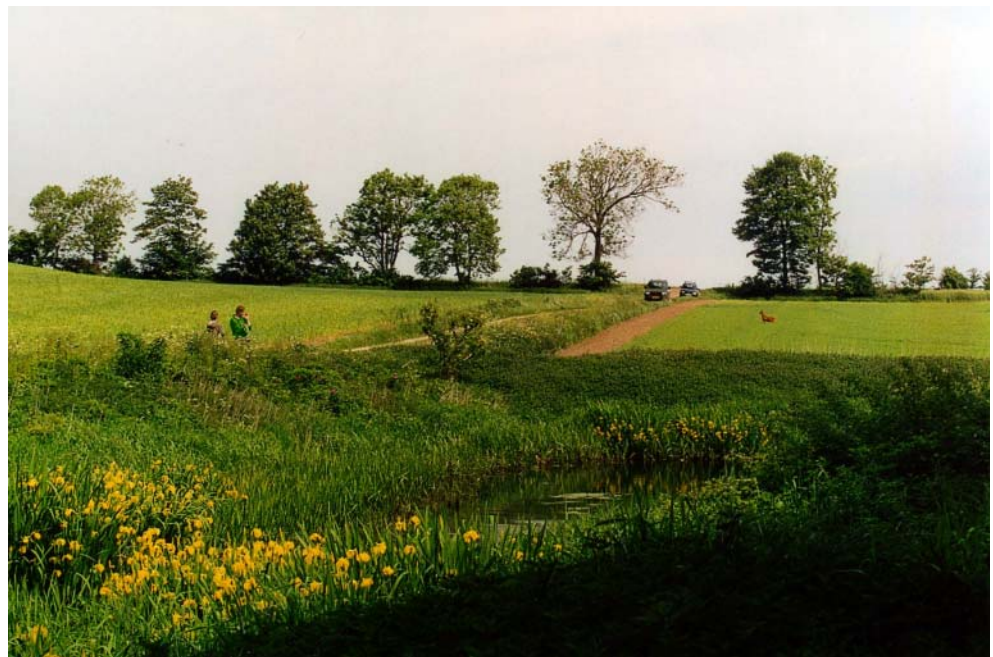
Figur 7: Muligheden for at opleve vilde dyr ude i naturen opfattes som et udtryk for naturkvalitet.

Aksen næringsrigdom – næringsfattigdom spillede også en væsentlig rolle i beskrivelserne af de småsøer og vandhuller, der var i flere af områderne (figur 6). Nogle af deltagerne påpegede fornøjelsen ved at se på gul iris og hybenroser ved en søbred, men samtidig dilemmaet med, at de var udtryk for et stort næringsindhold i søen. Oplevelsen illustrerer konflikten mellem ”det gode” og ”det smukke”, idet et objekt på den ene side måske kan give os en stor sanselig nydelse – nemlig de gule iris og hybenroserne – men på den anden side støder an mod vores moral og værdiforestillinger – nemlig ideen om at de næringsfattige biotoper er de bedste og mest værdifulde (Tuan 1993). Deltagernes refleksioner afspejler, at æstetisk påskønnelse ikke har sin rod i simple, klare relationer mellem dominerende værdibegreber og landskabsfremtræden. Tværtimod synes de at udspringe af betydeligt mere komplekse væv af værdiforestillinger og præferencer, som har en kulturel og social oprindelse (Eaton 1990, Egoz & Bowring 2004), men som også kan forstås ud fra en biologisk, evolutionær synsvinkel (Kellert & Wilson 1993).