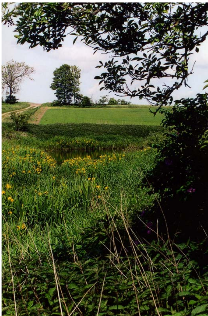
Figur 6: Væsentlige dele af diskussionen om naturkvalitet udspandt sig omkring aksen næringsrig – næringsfattig, med det næringsfattige som det attraktive og næringsrige som det uønskede.

Efter tilbagekomsten fra turen ud i felten præsenterede grupperne de områder, de havde været ude i, og de iagttagelser de havde gjort med hensyn til naturkvalitet. Deres iagttagelser af landskabet udspandt sig meget omkring aksen næringsrig – næringsfattig . Næringsfattig var det positive aspekt, mens næringsrig var det negative. En af deltagerne havde i terrænet tegnet et meget dramatisk billede af et frodigt og stærkt tilgroet areal, karakteriseret som ”det grønne helvede”.